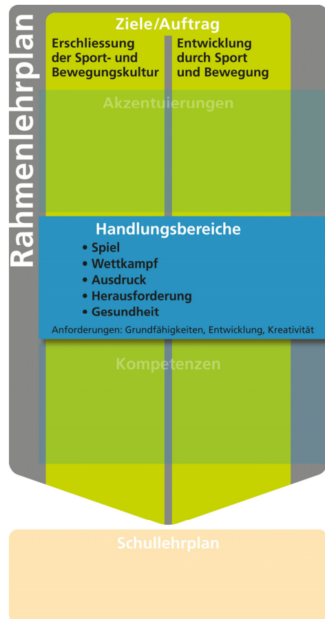
Grafik 2: Handlungsbereiche und Anforderungen

Die im Folgenden vorgestellten fünf Handlungsbereiche der aktuellen Sport- und Bewegungskultur mit ihren Merkmalen, pädagogischen Zielsetzungen und Anforderungen bilden die Basis für die anschließende Kompetenzorientierung.