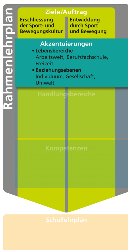
Grafik 1: Pädagogischer Auftrag und dessen Akzentuierungen

Damit das Potential dieser Akzentuierung genutzt werden kann, sollen Ziele des Sportunterrichts mit denjenigen der Berufsbildung überall dort miteinander verknüpft werden, wo es pädagogisch sinnvoll erscheint und unterrichtspraktisch umsetzbar ist. Dies gilt insbesondere für Gelegenheiten, bei denen die Vermittlung von Kompetenzen im Sportunterricht gleichzeitig körperliche Fertigkeiten, Kenntnisse und Haltungen fördert, die entweder direkt zur Ausübung einer Tätigkeit in einem Beruf erforderlich sind oder diese indirekt bzw. präventiv unterstützen.