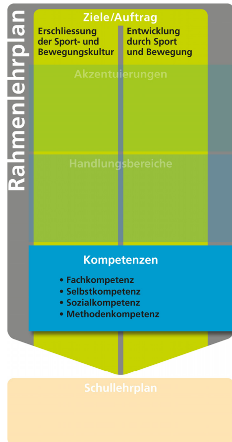
Grafik 3: Fachkompetenzen und überfachliche Kompetenzen